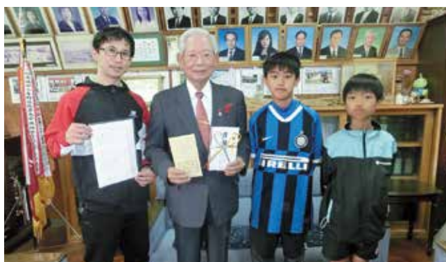
与那原小学校赤い羽根募金贈呈