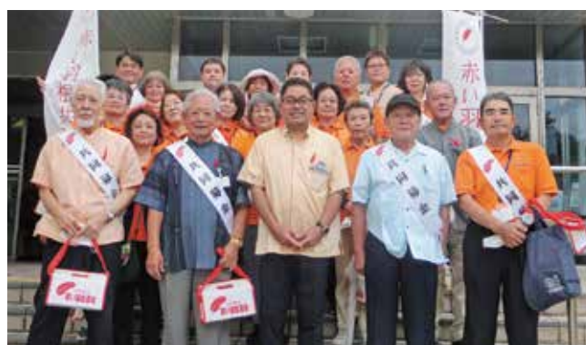
社協役員・民生委員児童委員による街頭募金