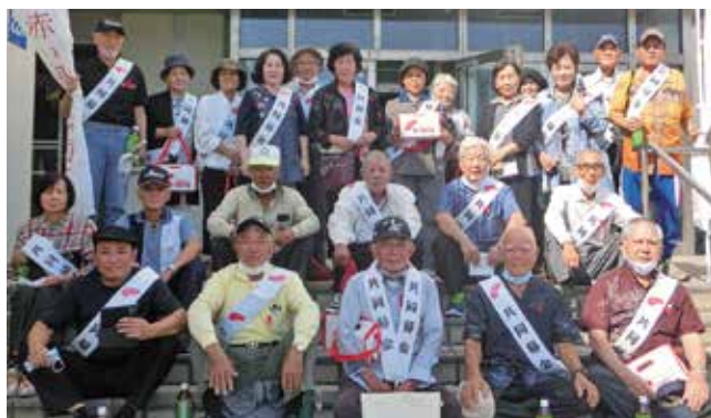
町老連役員による街頭募金