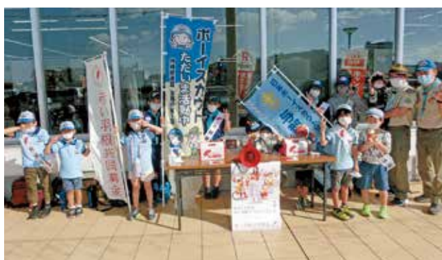
ボーイスカウト与那原第1団による街頭募金