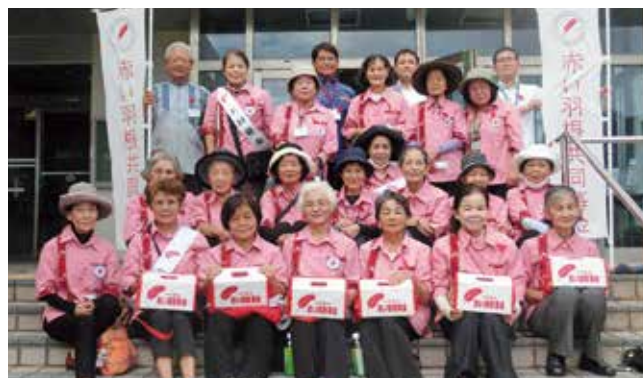
町赤十字奉仕団による街頭募金