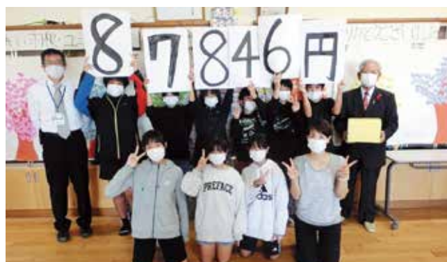
与那原東小学校赤い羽根募金贈呈