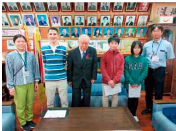
「赤い羽根募金贈呈式」与那原小学校 =令和6年1月22日