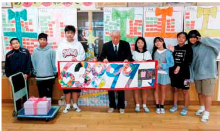
「赤い羽根募金贈呈式」与那原東小学校 =令和5年12月21日