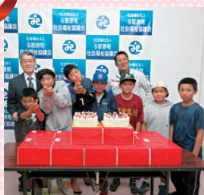
ヒカリ塗装工業(株)様より ボニールのケーキを寄贈