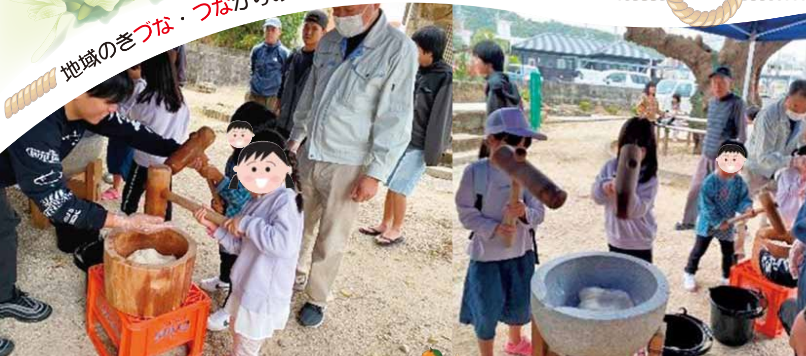
与那原区もちつき大会