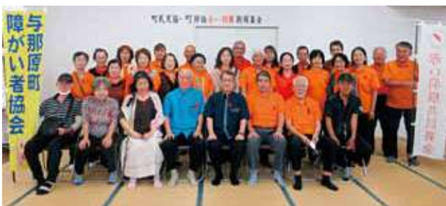
民生委員児童委員の皆様と合同での出発式

町障がい者協会は、赤い羽根共同募金からの配分金を活用し、日々活動を行っています。