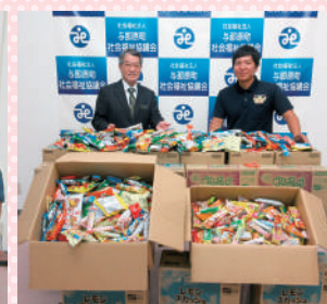
与那原東小学校PTA様より お菓子・飲み物を寄贈

このたび、地域でご活躍されているヒカリ塗装工業(株)様、与那原東小学校PTA様よりクリスマスケーキとお菓子・飲み物を多数ご寄贈いただきました。